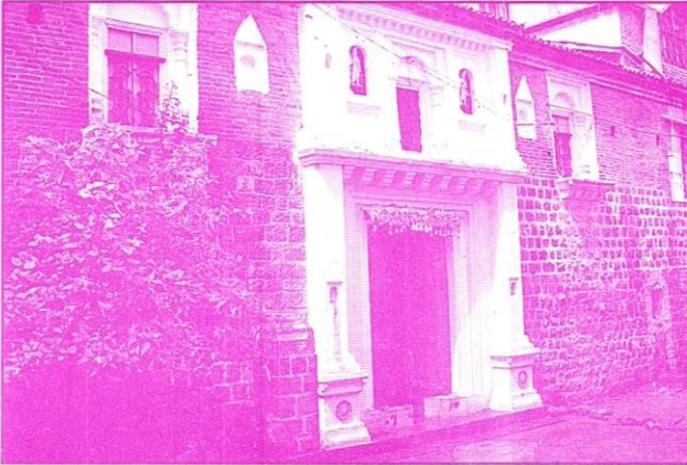
पूज्य काकीजी यांचे बेनाडी येथील घर